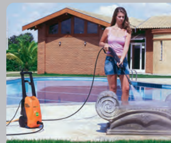
Áreas de lazer